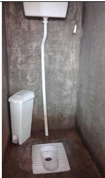
Drei eigene Toiletten für die Lehrer.