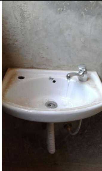
Die Lehrertoiletten sind fertig gestellt worden.