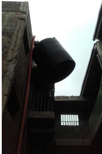
Der größere der geplanten Wassertanks wurde aufgestellt.