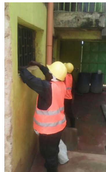
Gitter bei den Waschbecken