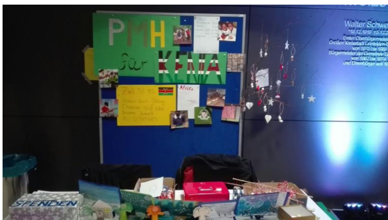
Stand bei der Weihnachtsfeier '15 mit Verkauf von Gebasteltem aus dem Kunstunterricht

Viele Aktionen und fleißige SchülerInnen haben auch in diesem Jahr wieder dazu beigetragen, dass die Aktion PMH für Kenia ein voller Erfolg war. Seit mittlerweile sieben Jahren arbeiten SchülerInnen des Philipp-Matthäus-Hahn-Gymnasiums in Echterdingen an einem Tag zugunsten von tumaini e.V. Zusätzlich werden in den Schulpausen Kuchenverkäufe organisiert und andere Aktionen gestartet, um Spenden zu sammeln. Insgesamt 4 600€ beträgt die diesjährige Spende. Herzlichen Dank für die super Unterstützung, euren treuen Einsatz und das Engagement.